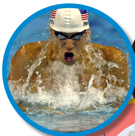
a. Michael Phelps

8 Atletas y superación personal: ¿conoces algunas de estas historias? Intenta relacionar cada una con su protagonista; ¡a ver cuántas sabes!