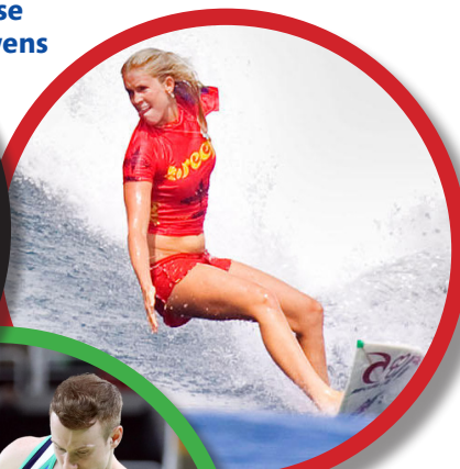
c. Bethany Hamilton