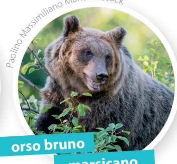
orso bruno marsicano